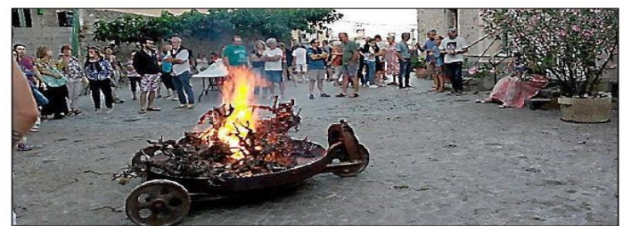
Le feu sur la place du village.

La commune a fêté les feux de la Saint-Jean. Cinq jeunes montalbanais ont porté la flamme jusqu'à la place du village et allumé le feu avec leurs lanternes. La population était venue en nombre pour parti-