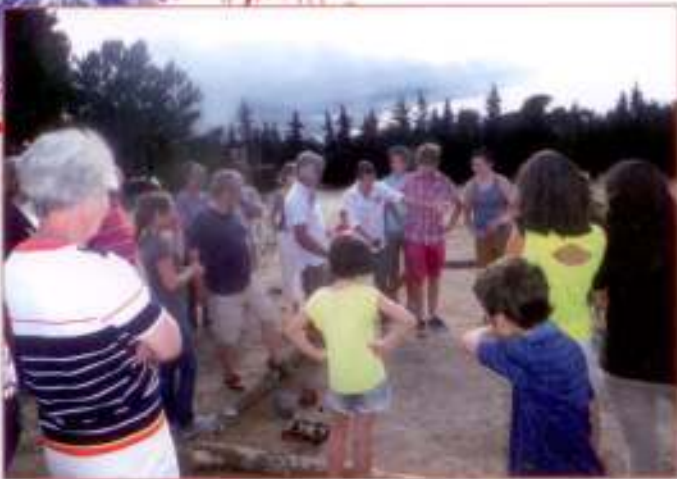
Les montalbanais ont visité les installations réalisées pendant le chantier intergénérationnel, ici le terrain de pétanque...