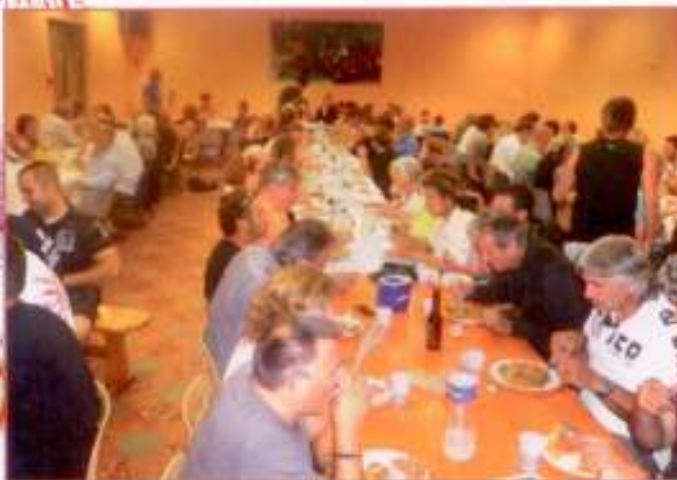
150 personnes ont dégusté la paëlla du Comité et guinché tard dans la nuit.