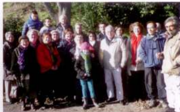
Une première sortie à Collioure pour le marché de Noël le 6 décembre dernier.