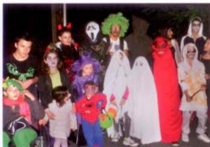
Les petits monstres et les sorcières de Montalba.