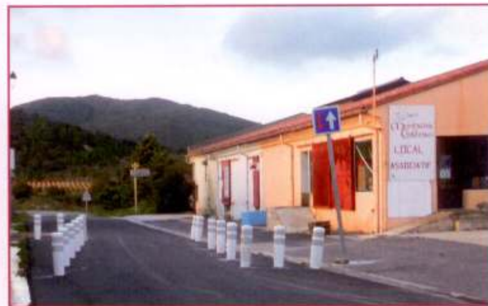
Sécurisation sortie Trévillach

Tous les travaux ont été réalisés à titre gracieux par une équipe d'élus, de bénévoles et les jeunes du village.