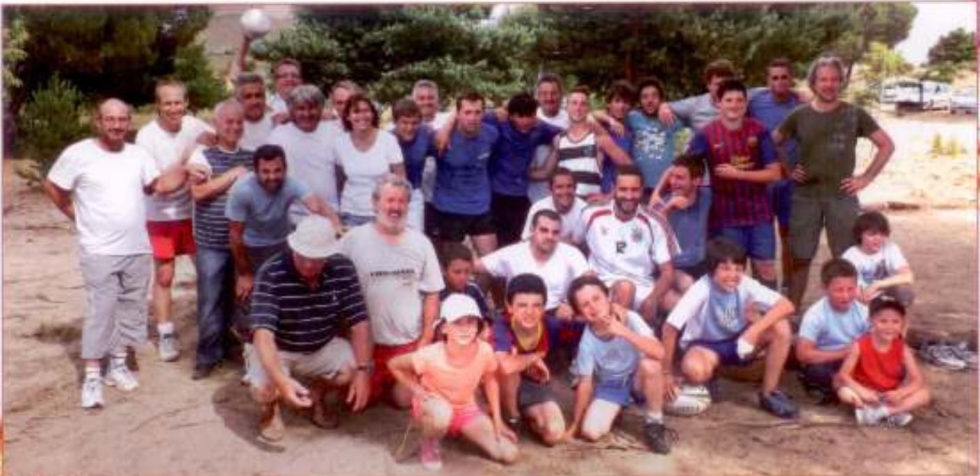
Un match de foot et de rugby, ou jeunes et moins jeunes se sont affrontés... amicalement.