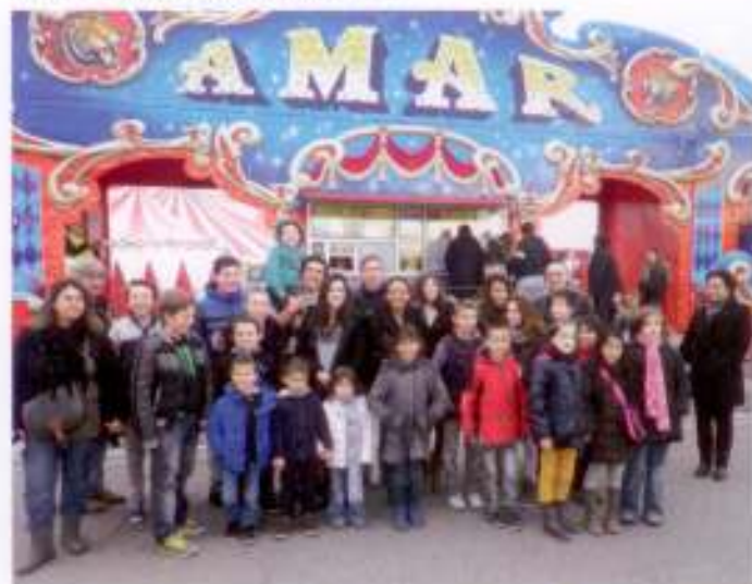
24 enfants et jeunes du village invités par la municipalité au Cirque Amar.