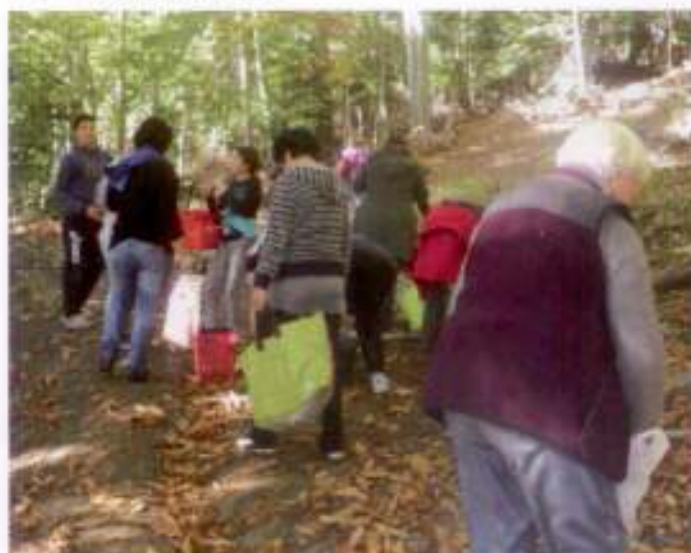
Ramassage de châtaignes dans la forêt de Rabouillet.