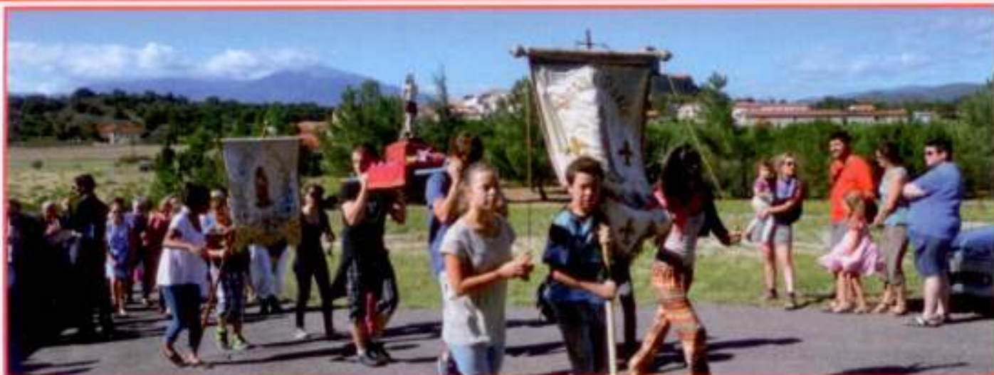
Les jeunes ont participé massivement à la procession.