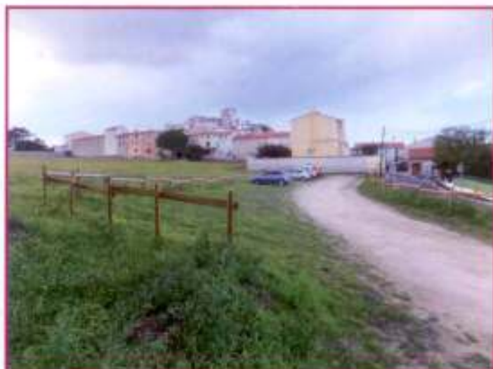
Aménagement des parkings