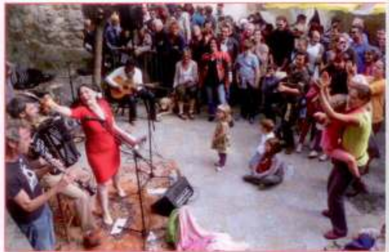
Pieds nus et robe rouge...