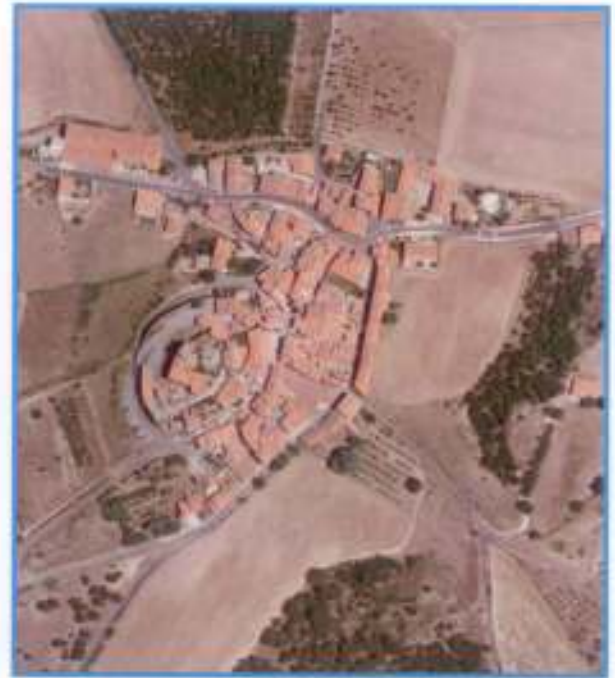
Montalba-le-Château vu du ciel

Il faut savoir que la loi ALUR, applicable en juillet 2015, transfère les compétences d'instruction des dossiers d'urbanisme de la DDTM à la Communauté de Communes. C'est donc la CC Roussillon Conflent qui instruira nos demandes l'année prochaine, probablement de façon progressive entre janvier et juillet.