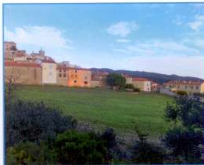
Au premier plan, la zone envisagée pour la construction.

Conscients de la nécessité de développer le village pour permettre l'accueil de nouveaux arrivants, être en capacité d'accueillir et d'héberger des amis, de la famille, des touristes, créer et faire vivre un lieu multi-services (bistrot, épicerie ...) nous réfléchissons aux différentes options qui pourraient aboutir à la constructions de maisons nouvelles et d'un gîte.