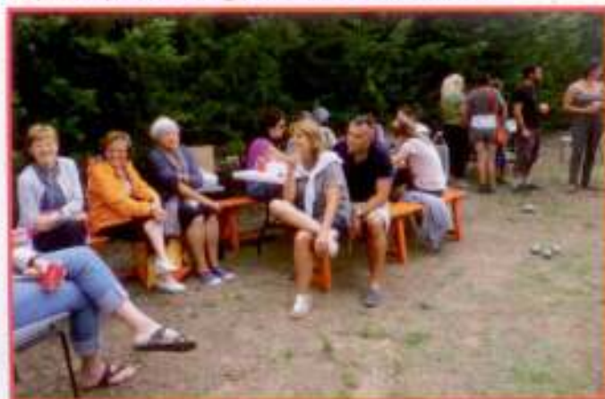
Le coin détente entre deux parties.