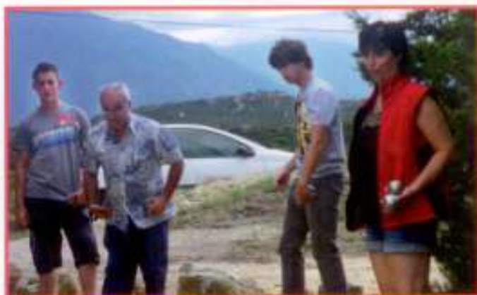
La pétanque, toutes générations confondues.

Un concours de boules adultes-enfants, organisé par le foyer rural, a comblé une sympathique après-midi à l'ombre du parc de jeux. Les équipes ont joué dans la bonne humeur pour arriver sur le podium. Une remise des lots offerts par la Mairie et les nombreux partenaires s'est faite sous une salve d'applaudissements.