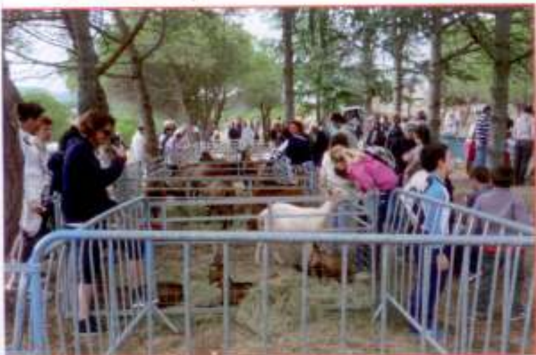
Les animaux attirent toujours la curiosité.

Pour sa deuxième édition, la fête de la chèvre, le 5 octobre dernier a été un grand succès. Une réussite qui est avant tout l'œuvre de tout un village.