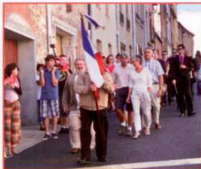
Les élus en tête du cortège.

L'apéritif dansant comptait de nombreuses personnes et chacun a su apprécier cette journée festive avec également la présence remarquée des sardanistes d'Ille sur Têt. Plus tard dans la nuit, c'est le groupe de Gino Torralba «El corrazon latino» qui a conquis les nombreux danseurs.