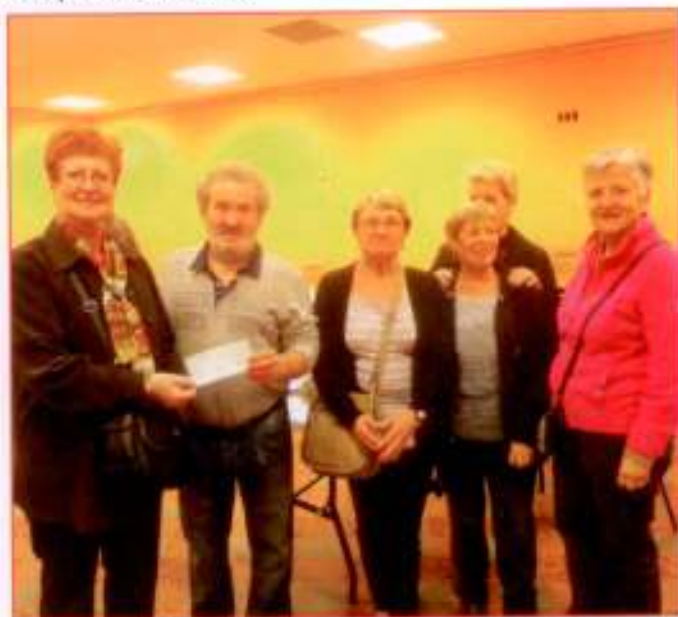
Un chèque de 320€ remis au Secours Populaire au titre de la Solidarité.

Au château ouvert exceptionnellement ce week-end là, les artisans avaient disposé leurs étals dans la cour. Dans la vaste salle des gardes, une trentaine d'artistes avaient accroché aux cimaises leurs œuvres sur un thème imposé, la chèvre. Leurs droits d'inscription, 320 euros ont été versés au Secours populaire, un geste de solidarité souhaité par les organisateurs avec les plus démunis.