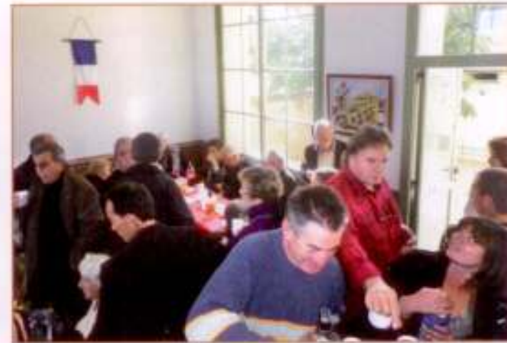
Beaucoup de monde au foyer rural pour le traditionnel apéritif de fête nationale.