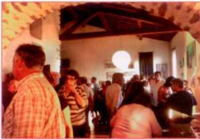
1500 visiteurs le dimanche à l'expo !

Avec des projections de films, un quizz sur la chèvre, des promenades à cheval, un maréchal ferrand, et un immense banquet dans la rue, la journée était à l'image de cette phrase sur le tableau des amoureux de Chagall où une chèvre joue du violon : «le bonheur ne serait pas le bonheur sans une chèvre jouant du violon» . Vive la 3 ème édition !