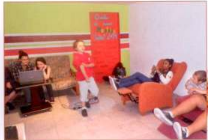
Les jeunes ont investi le local associatif.