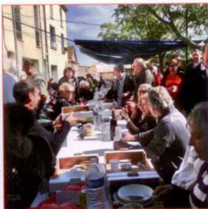
350 convives, Cami de Vinca.

En dépit d'un vent frais, près de 4.000 visiteurs ont afflué dans le village pour admirer les reines du jour, les chèvres. Une quarantaine ruminait paisiblement dans des enclos, dans la pinède prêtée par Louis Gély, soumise aux caresses des enfants et aux questions des plus grands. La traite a été faite plusieurs fois en public et de très beaux spécimens d'alpines chamoisées, de poitevines, de roves ou de saanens faisaient l'admiration des badauds.