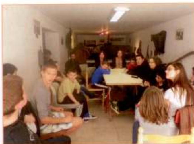
De nombreux besoins pour la population sont à satisfaire et notamment pour nos jeunes.

*Rappelons, que les différentes taxes résultent de l'application des taux aux bases d'imposition (valeurs locatives).