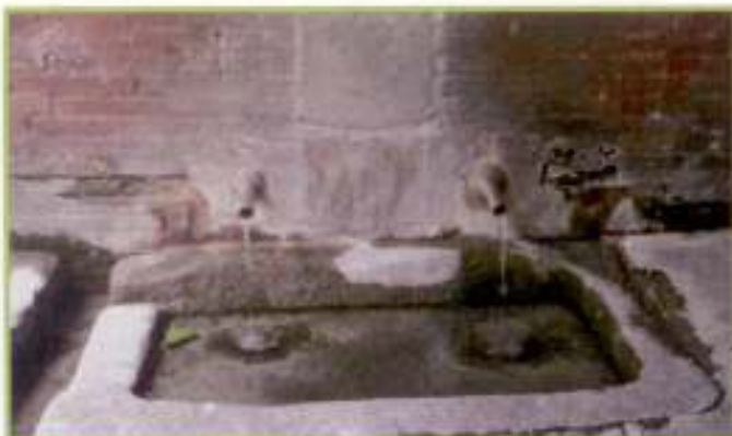
Les arrivées d'eau en inox.