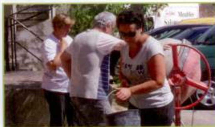
Pas de sexisme à Montalba !

Depuis plusieurs samedis, des bénévoles œuvrent d'arrache-pied pour mettre en sécurité le caveau à la cave coopérative qui va accueillir la junior association. Du 7 au 12 juillet les jeunes vont réaliser eux-même la décoration et