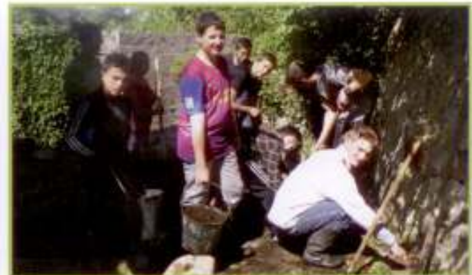
Tous au pied du mur.