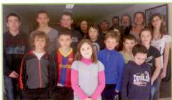
Les jeunes au grand complet.

Un dossier d'habilitation pour intégrer le réseau National des Juniors Associations monté par les jeunes, vient d'être accepté.