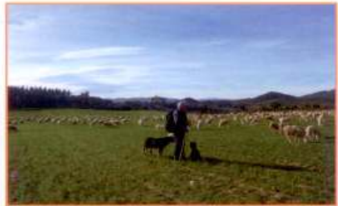
Un projet aux retombées néfastes, en particulier pour les bergers qui seraient privés de terres.

projet, et recueilli 80 signatures. La plupart des professionnels a manifesté leur opposition. D'évidence, les pêcheurs ne sont pas les bienvenus à Montalba. Le conseil municipal a de plus réaffirmé avec force, son soutien à une agriculture raisonnée, respectueuse de l'environnement, de la biodiversité et s'est déclaré prêt à soutenir et favoriser toute installation allant dans ce sens. Pour l'heure le projet de pêcheurs semblent en sommeil mais la vigilance s'impose.