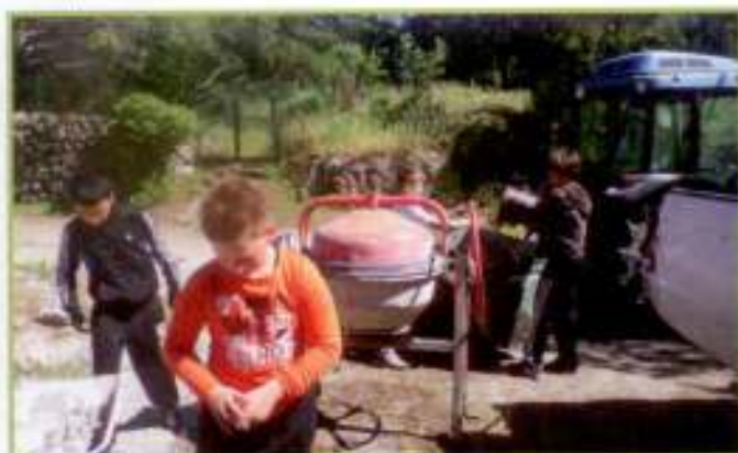
Du petit au plus grand, tout le monde participe.

Les réunions de concertation du 12 mars et du 10 mai ont permis de sonder les différents centres d'intérêts, les réalisations possibles pour tendre unanimement vers un besoin de disposer d'un local. Parmi les nombreuses idées, leur choix d'action s'est porté sur une proposition d'aider nos aînés qui ont du mal à se rendre aux colonnes de tri sélectif en leur proposant des journées de collecte; de nettoyer le terrain de jeux pour y créer un terrain de pétanque, d'organiser des animations et activités. Afin de pouvoir les concrétiser ils ont organisé un repas le 29 juin, les fonds récoltés leur permettent de penser une première activité ludique cet été.