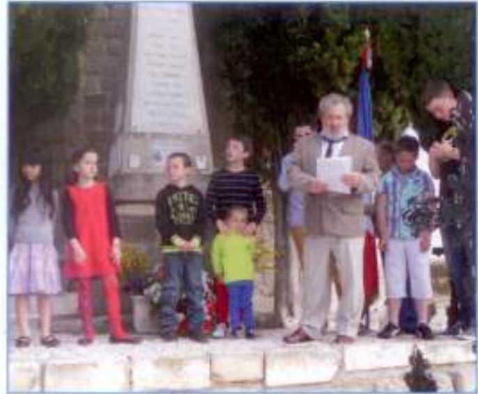
Les enfants attentifs aux paroles du maire.

Aujourd'hui la crise économique fait des ravages, comme à chaque fois, le chômage, la mal-vie, la