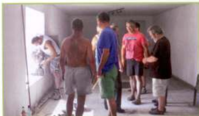
Un qui travaille...

Depuis plusieurs samedis, des bénévoles œuvrent d'arrache-pied pour mettre en sécurité le caveau à la cave coopérative qui va accueillir la junior association. Du 7 au 12 juillet les jeunes vont réaliser eux-même la décoration et