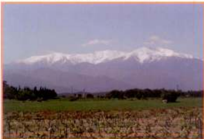
Le Canigó vu de Montalba-le-Château.

Le Massif du Canigó a été labellisé Grand Site de France en juillet 2012. Le réseau des Grands Sites de France regroupe des territoires remarquables qui ont en commun « d'être à la recherche de fonctionnements novateurs, permettant d'assurer un accueil de qualité tout en respectant l'esprit des lieux et d'engendrer un impact positif sur le tissu socio-économique environnant ».